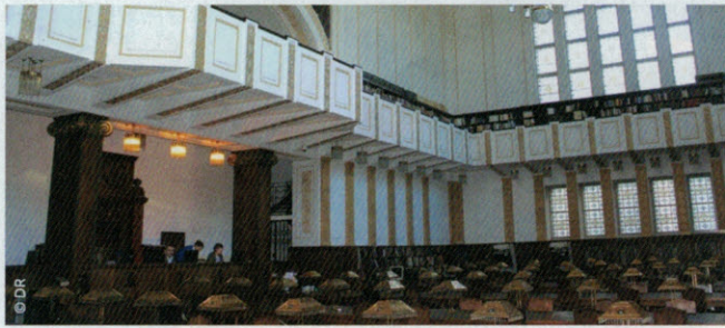
➤ Dans la capitale croate, le palais Lubynskin est un édifice Art nouveau datant de 1913.