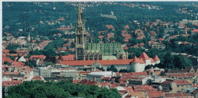
➤ À Zagreb, une offre hôtelière adaptée pour l'accueil de séminaires et petits congrès.

une plénière de 620 m 2 (divisible en trois). Le très central Palace (4*) est le plus ancien hôtel de Zagreb (1907). Rénové récemment, cet hôtel de style Art déco compte 122 chambres et suites, 5 salles de réunion (150 pax) et un élégant café-restaurant. Le Dubrovnik (4*) rassemble deux immeubles dont le plus ancien, datant de 1929, donne sur la place Ban Jelačić. L'hôtel dispose de 222 chambres (dont 8 suites), un lobby récemment rénové, 10 salles de réunion (200 pax). Le récent Double Tree by Hilton (4*) se trouve au cœur du nouveau quartier d'affaires de Radnicka (ou Green Gold), à 20 mn à pied du centre-ville. Ce bâtiment de verre comprend 152 chambres et 4 salles de séminaire (300 pax). En face se trouve le Congress Center Forum Zagreb, doté de 7 salles de réunion, dont un auditorium de 210 places.