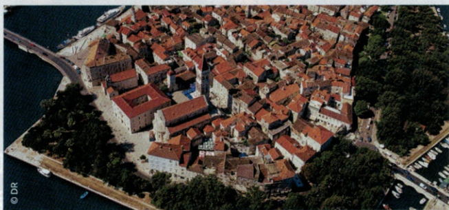
➤ Trogir a été classé au patrimoine mondial par l'Unesco.

Le parc naturel de Plitvice se trouve à deux heures de route de Zagreb, une merveille de la nature avec ses seize lacs reliés les uns aux autres par une centaine de chutes d'eau. Plus près de Zagreb se trouve le Zagarje, la région des châteaux, visitée notamment pour la ville baroque Varazdin. On notera aussi que la station balnéaire d'Opatija se trouve à 1h15 de la capitale croate. Les excursions ne manquent pas non plus depuis Split. On peut consacrer une journée à la visite de la jolie petite ville de Trogir (Unesco). On peut pousser plus loin jusqu'au parc national de la Krka proche de Sibenik, pour y admirer de magnifiques chutes, ou embarquer à bord d'un bateau pour les îles de Brac et Kvar. ●